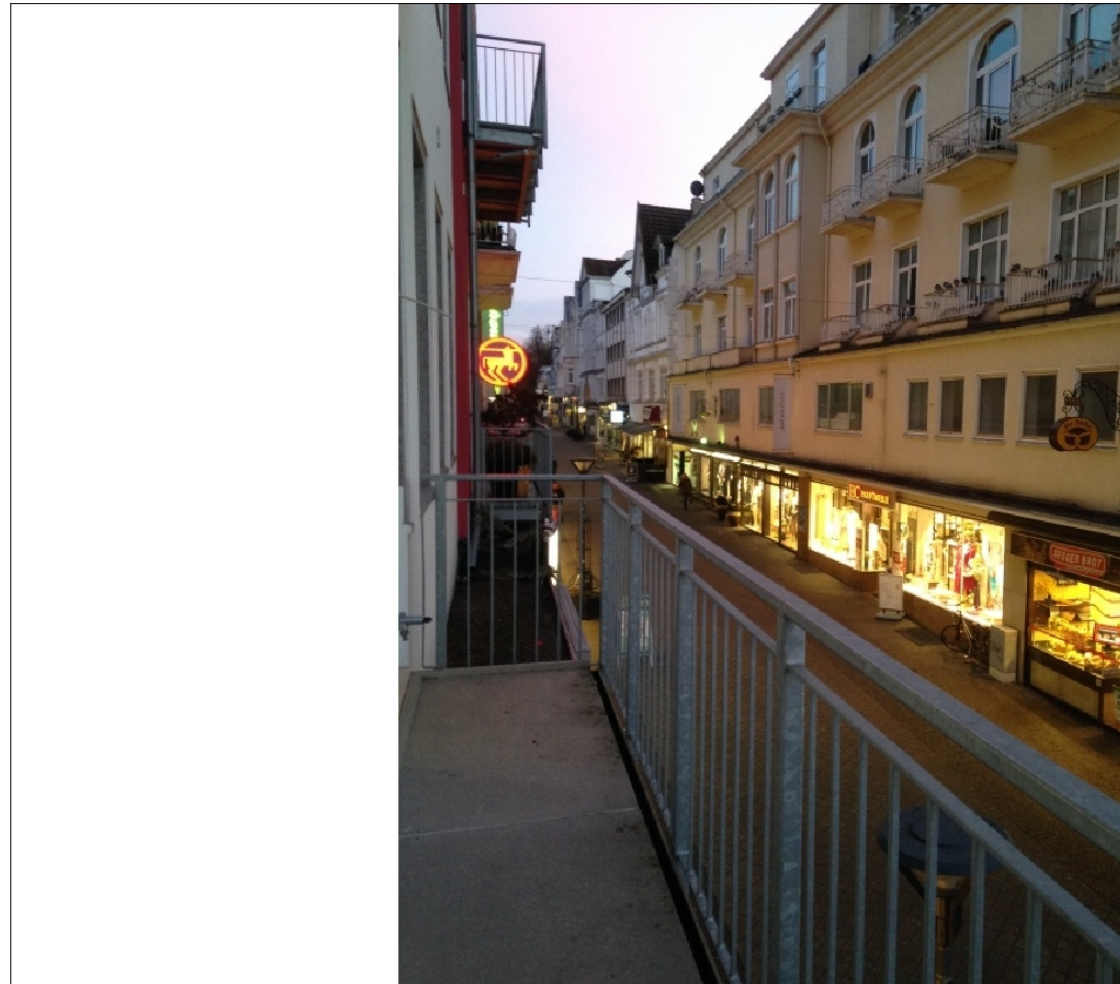
Zusatzbild für Galerie

Mieterprovision EUR: 1 KM zzgl. 19 % Mwst