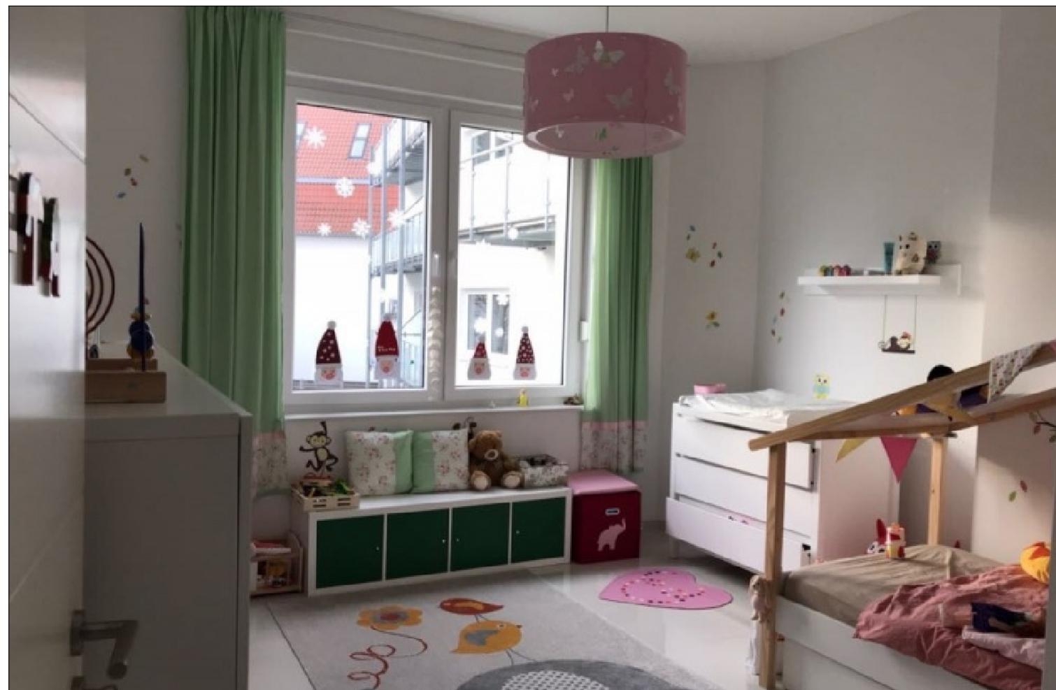
Zusatzbild für Galerie