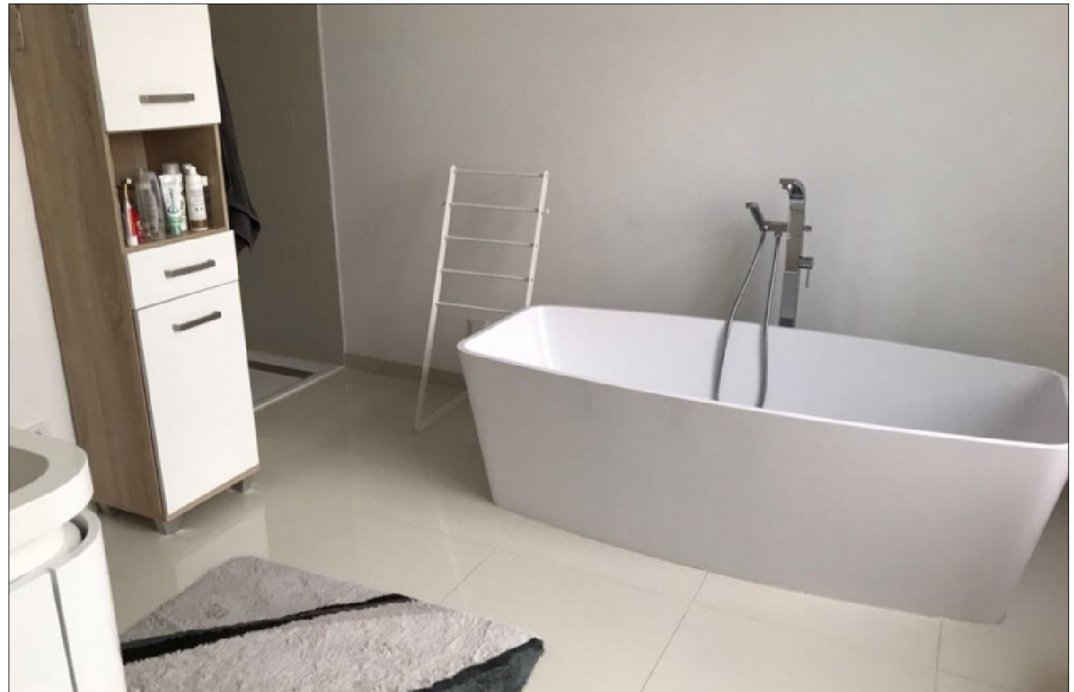
Zusatzbild für Galerie