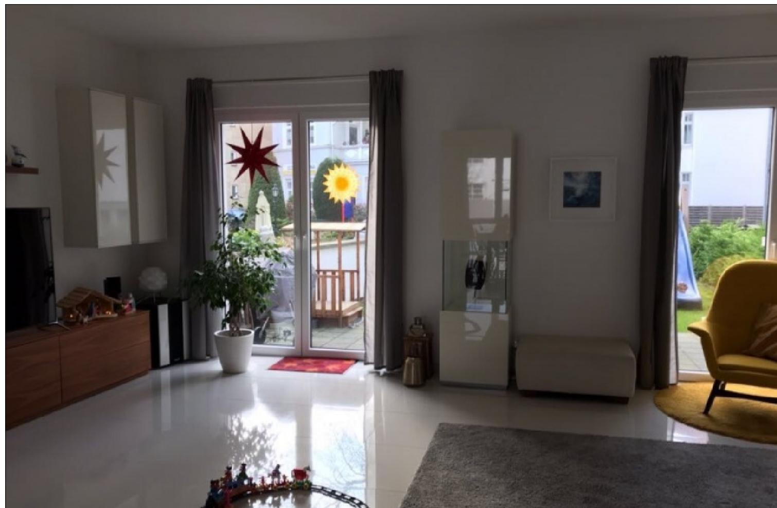
Zusatzbild für Galerie