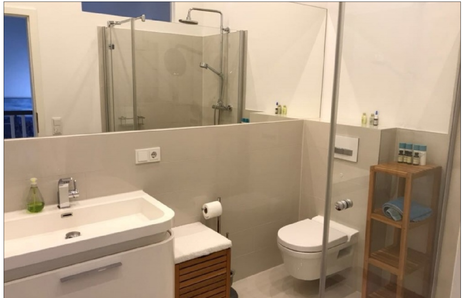
Zusatzbild für Galerie

ROT GmbH Buero: Klosterstrasse 21 32545 Bad Oeynhausen Tel: 01605000179 Fax: 05731-1531404 E-Mail: info@bo-immo.de