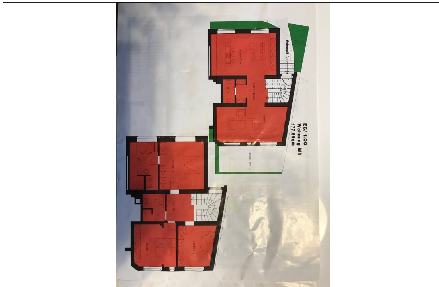
Zusatzbild für Galerie