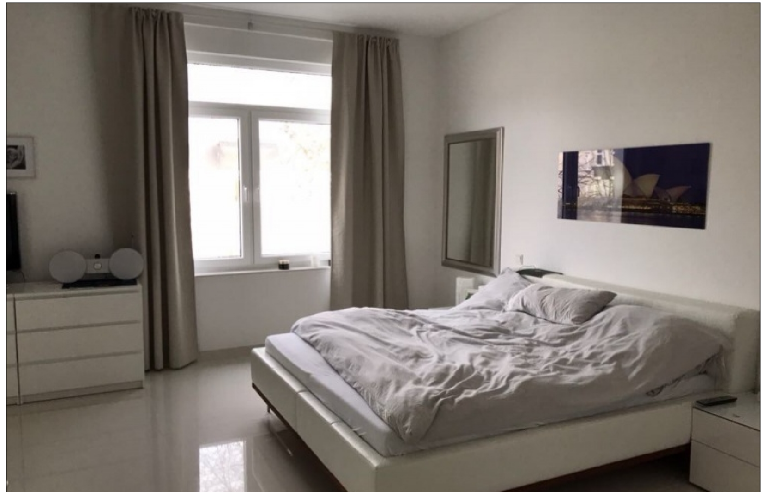
Zusatzbild für Galerie

ROT GmbH Buero: Klosterstrasse 21 32545 Bad Oeynhausen Tel: 01605000179 Fax: 05731-1531404 E-Mail: info@bo-immo.de